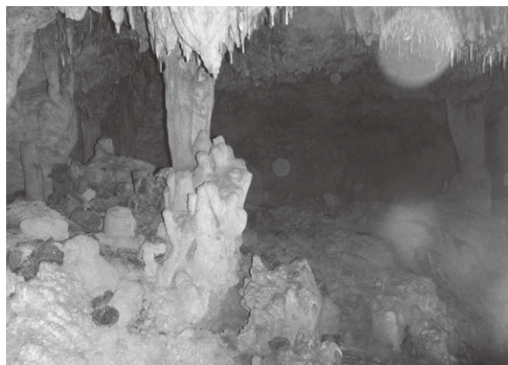
▲ ガマ内部（当時の空き缶や靴、陶器等が残っている）

例を挙げるなら、ガマという自然にできた洞窟があって、その中は鍾乳洞のようで、真つ暗で、劣悪な場所だと地面も靴が張り付いて抜けなくなるくらいぬかるんでいるのですが、戦争中はそこで、足を切断する手術が行われていたり、12〜13歳の子どもが明かり無しで重労働を強いられていました。これはほんのごく一部ですし、これだけで戦争の痛みを伝えられるとは全く思っていません。ですが、少しでもこれを読んだ方が興味を持ち、ご自身の出身地や京都などといった身近な所から調べてみて、そしてどんなことがあったのかを知り、現地を訪れ体験し、その感想なりを周囲に広め、少しずつ平和の輪が広がれば、これほどに嬉しいことはありません。そしてピースナウは生協委員しか参加