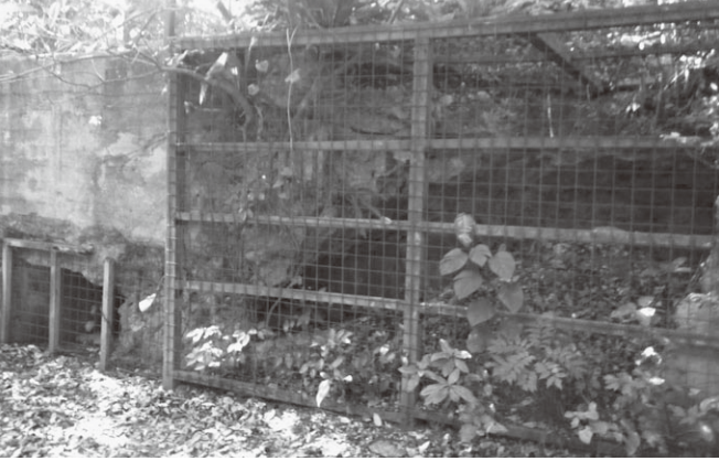
▲ 首里城の横にある旧陸軍司令部壕（半壊してる）

まず、物事に対する見方というものがガラッと変わりました。FWを通して、『物事に対して疑問を持って見る目』と『いろいろな側面から見る目』を鍛えることができました。