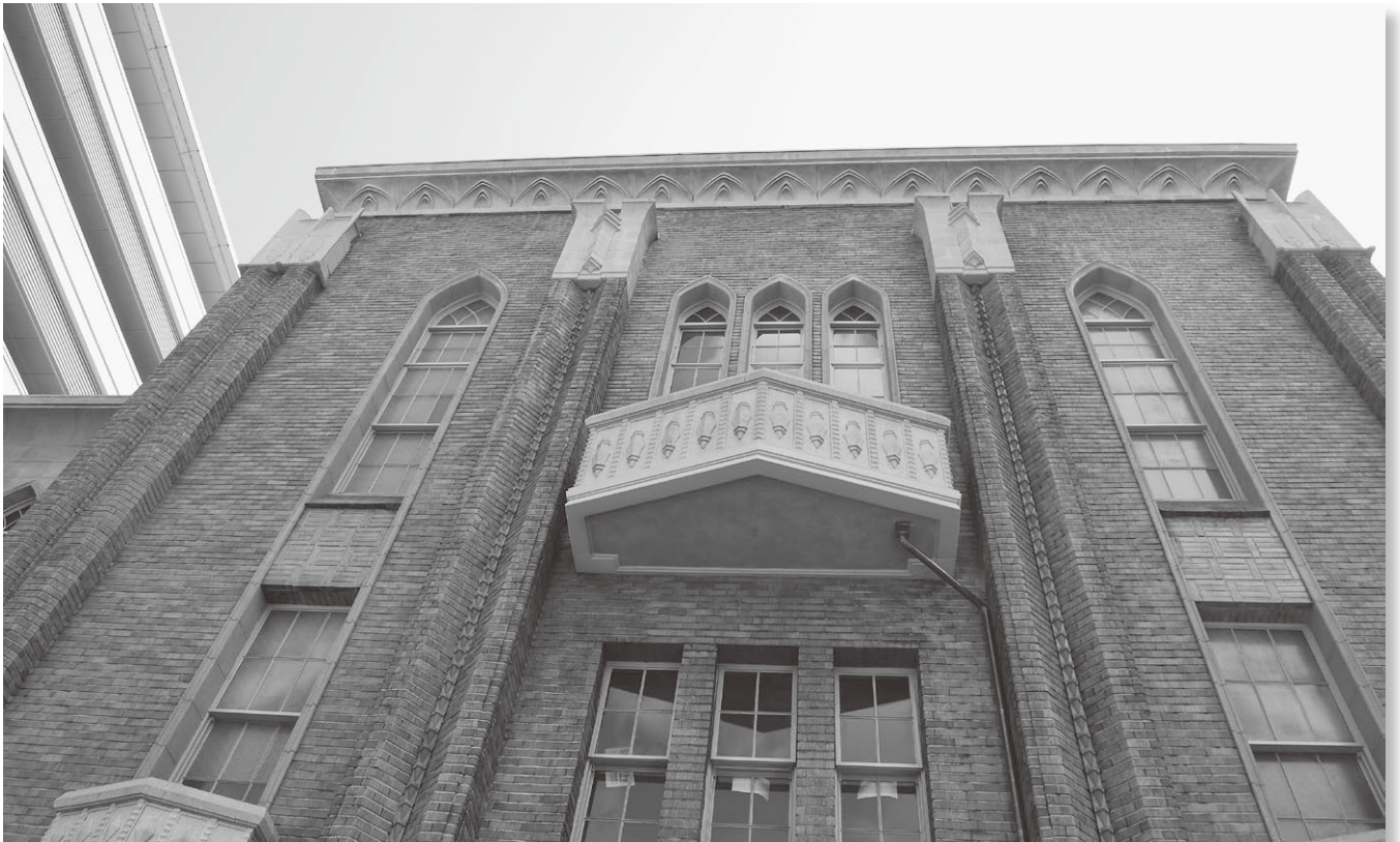
旧附属図書館棟改修工事が完了（6ページ参照）

発行 京都府立医科大学生活協同組合 発行人 専務理事 末廣恭雄 〒602-0841 京都市上京区河原町広小路梶井町465 TEL 075-251-5952