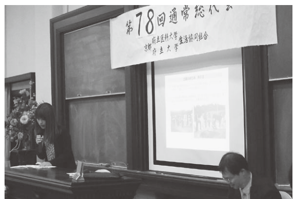
米粉・米卵プロジェクトの報告

5月28日に総代会が開催され、全議案が可決されました。 役員の改選が行なわれ、総代会直後に行なわれた第1回理事会にて、京都府立医科大学の渡邊能行先生が理事長に選出されました。 また、京丹後農村体験ツアー、米粉・米卵プロジェクト、Peace Now! 2009、府大食堂改善プロジェクトの報告が行なわれました。