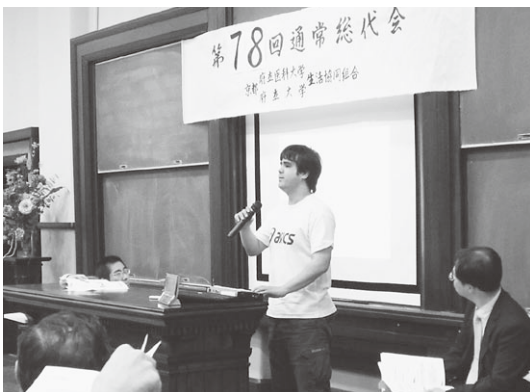
府大食堂改善プロジェクトの報告

また、事業活動の内容、決算処理、事業活動予算を承認する機関でもあります。「大学生協でこんな事があったらいいな」「店舗でこんな商品をおいて欲しい」「こんなメニューがあったらいい」「こんな企画をやりたい」など、身近な要求はもとより様々な思いや願いを実現していくため、組合員活動や事業活動の課題や方針を確立する機関が総代会です。