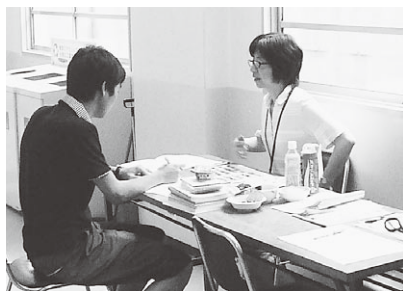
◀◀栄養士さんとの食生活相談の様子