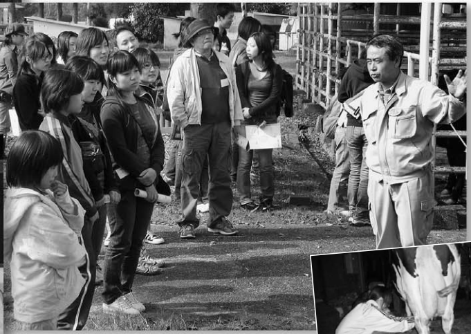
農村体験ツアー 今回で3回目。綾部市を訪問しました。