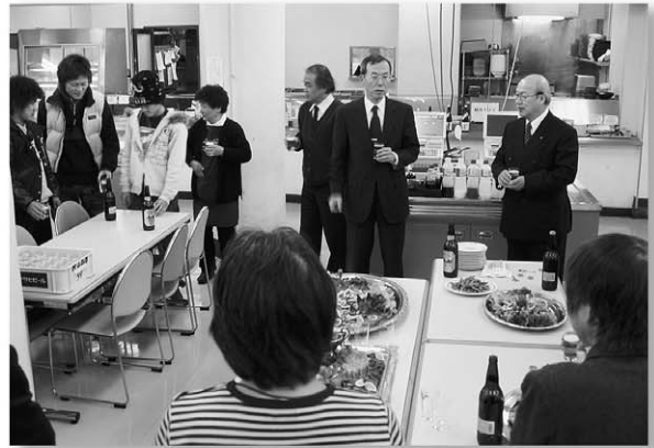
医大キャンパス運営委員会（新年交歓会） 定例で2カ月に1回、お店からの報告と組合員の意見交換の 場として開催しています。