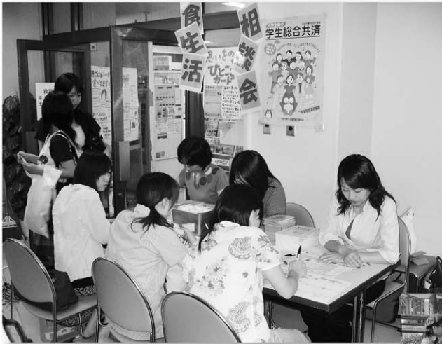
食生活相談 組合員の健康チェックの場として食生活相談会を医大 花園・看護でそれぞれ年に1~2回開催しています。