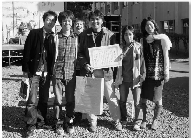
Caps(府大生協学生委員会 CO-OP ACTIVITY PROMOTIVE SOCIETY) が学長表彰を受けました。