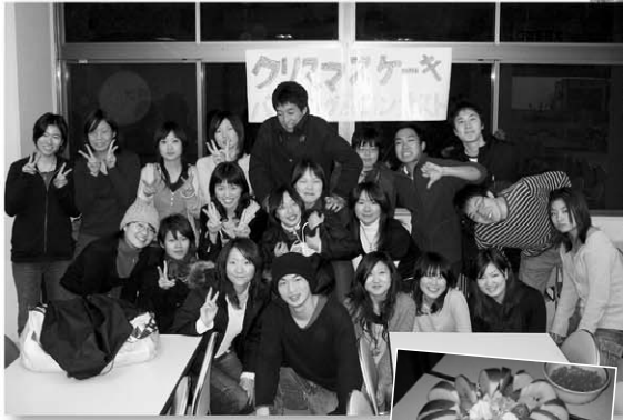
Xmasの時期にケーキを作って コンテストを行ないました。